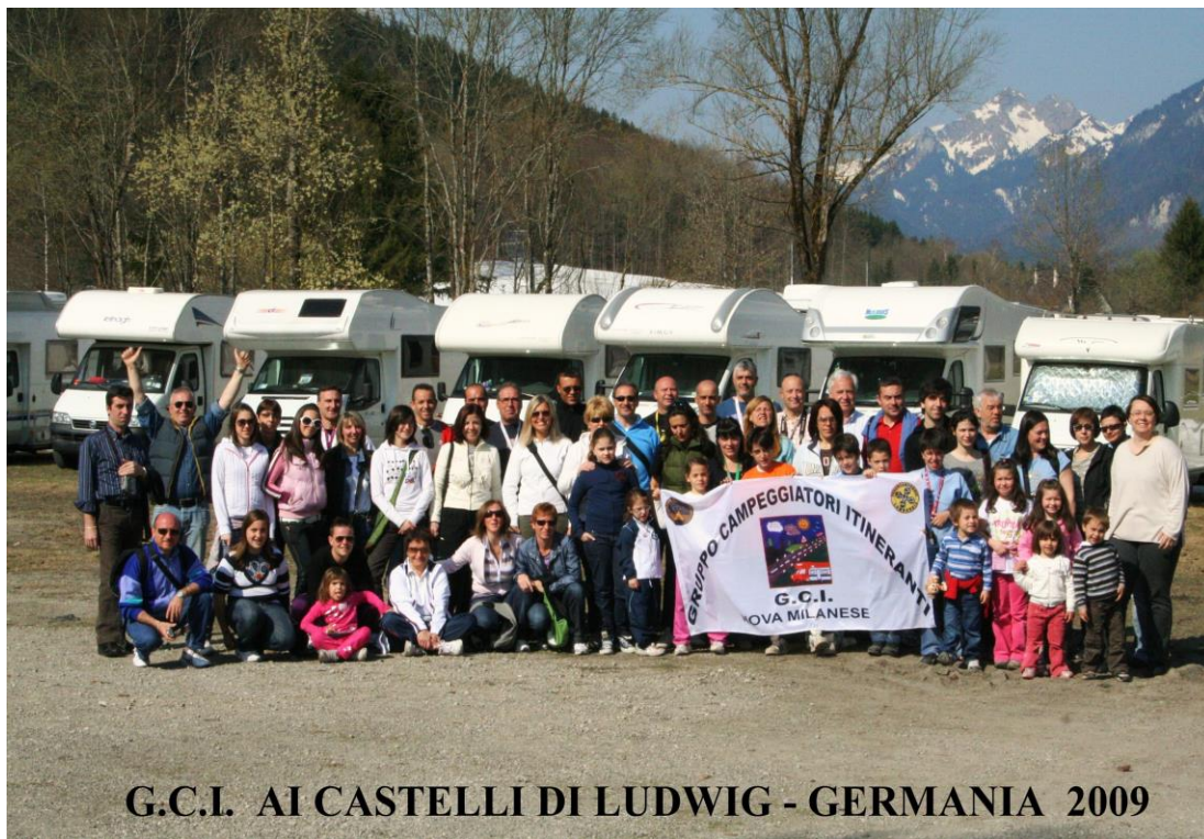
G.C.I. AI CASTELLI DI LUDWIG - GERMANIA 2009